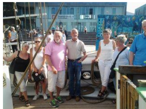
Rundvisning på "Fulton"

Om aftenen grillede vi og hyggede os i det dejlige vejr. Holbæk Havn havde arrangeret et kæmpe fyrværkeri, som vi havde første parket til.